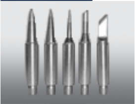
Replacement Soldering Tips H Series